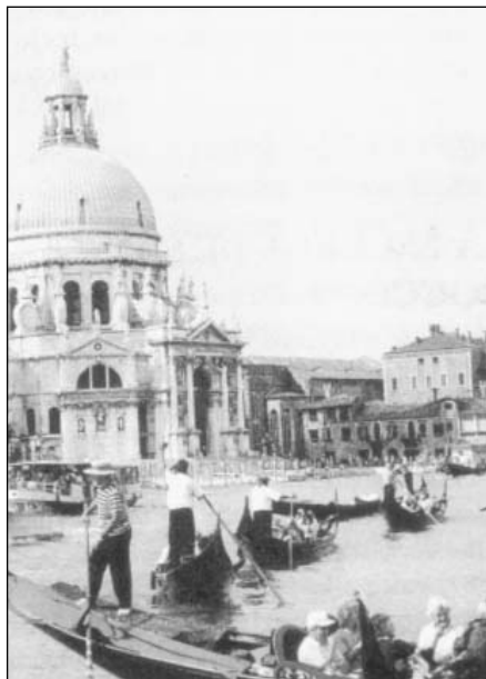
Santa María della Salute

Situada cerca de la Academia y ubicada en el inacabado palacio de Venier dei Leoni. Acoge obras de artistas contemporáneos internacionales como : Mondrian, Klee, Picasso, Kandinski, De Chirico, etc.