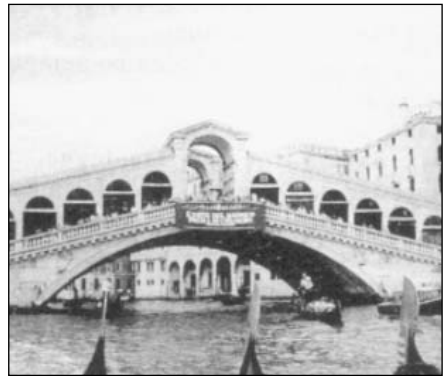
Puente de Rialto

Salva el gran canal en su punto más estrecho, es el más famoso y admirado puente veneciano. En su punto más alto tiene una altura de 7'5 m. y mide 48 mts de largo. Junto a él, en el lado izquierdo, se halla el Palacio renacentista de los Camarlengos ; las fábricas viejas de Scarpagnino , actualmente utilizadas, como mercado de abastos y las Fábricas nuevas, obra de Sansovino . En el otro lado del río está la oficina central del Servicio Postal, en el edificio Fondaco dei Tedeschi .