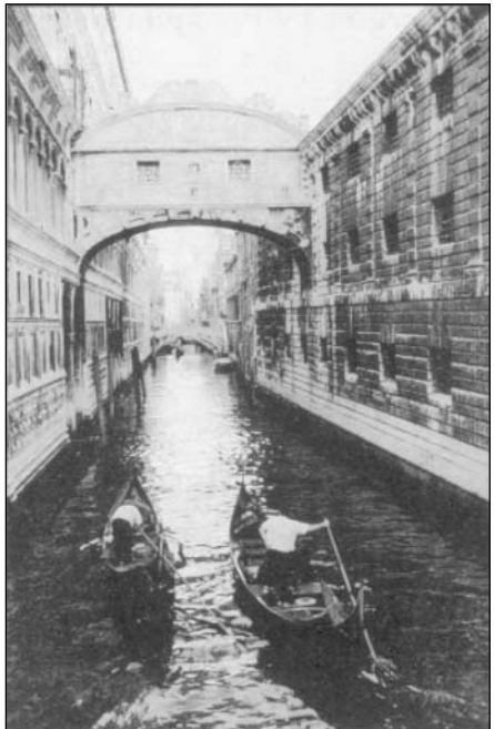
Puente de los Suspiros

Es el espacio situado entre los muelles y la plaza San Marcos. Las columnas que presiden el paisaje fueron traídas hasta aquí desde Oriente, en compañía de una tercera que, según la leyenda, yace en el interior del canal. Las dos restantes aparecen coronadas por dos figuras : la de San Teodoro , patrón de Venecia, cuando está dependía de Bizancio y la de un León alado , símbolo