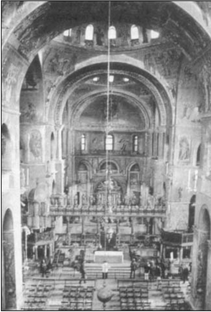
Interior de San Marcos