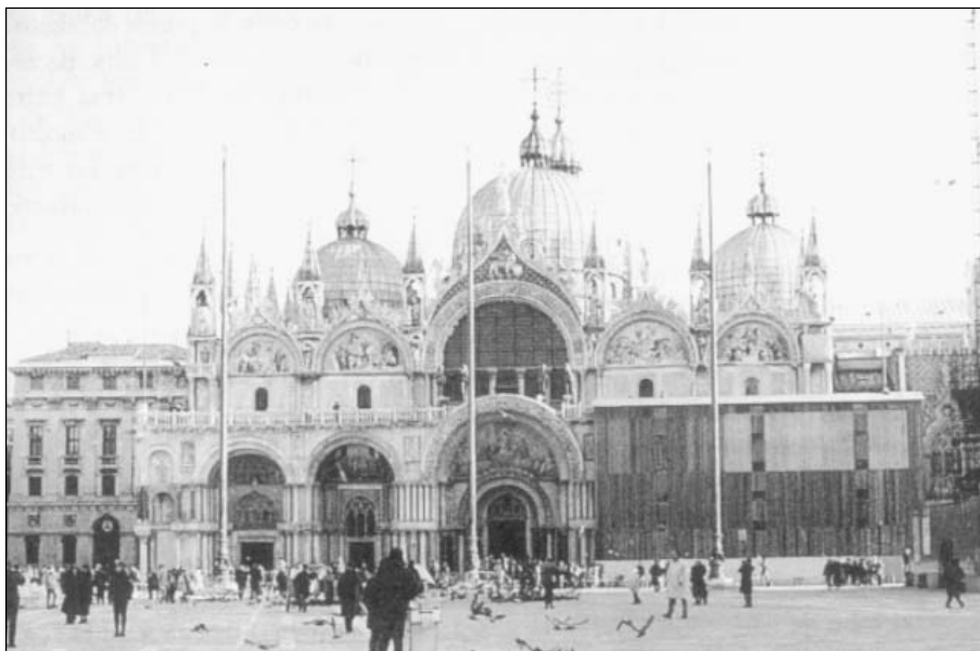
Basilica de San Marcos

Formando parte de su perímetro aparecen: primero, la Basilica de San Marcos , edificio que atrae la atención del viajero de manera casi magnética; segundo, la Procuratie Vecchie , junto a la que destaca la Torre del reloj con las famosas estatuas de los moros que hacen sonar las campanas para dar las horas; tercero, la Procuratie Nuove , donde trabajaron artistas de la talla del Bergamasco, Sansovino o Longhena, delante de la cual, se levanta el Campanille ; y por último, el Ala Napoleónica , del siglo XIX, que alberga el Museo Correr .